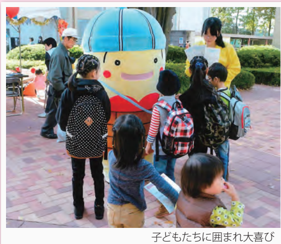
子どもたちに囲まれ大喜び