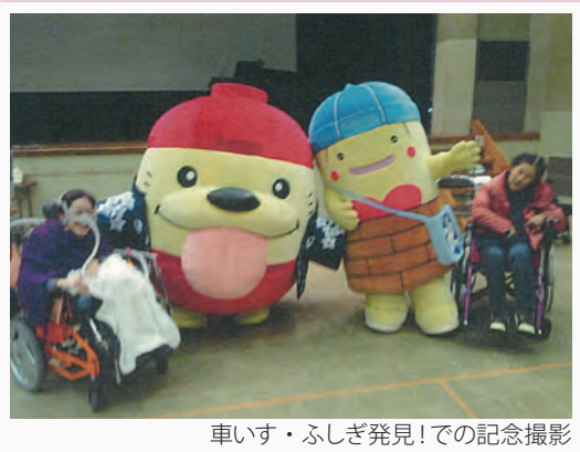
車いす・ふしぎ発見!での記念撮影

問合せ：東大和市社会福祉協議会まで ☎ 564-0012 / FAX: 564-3680