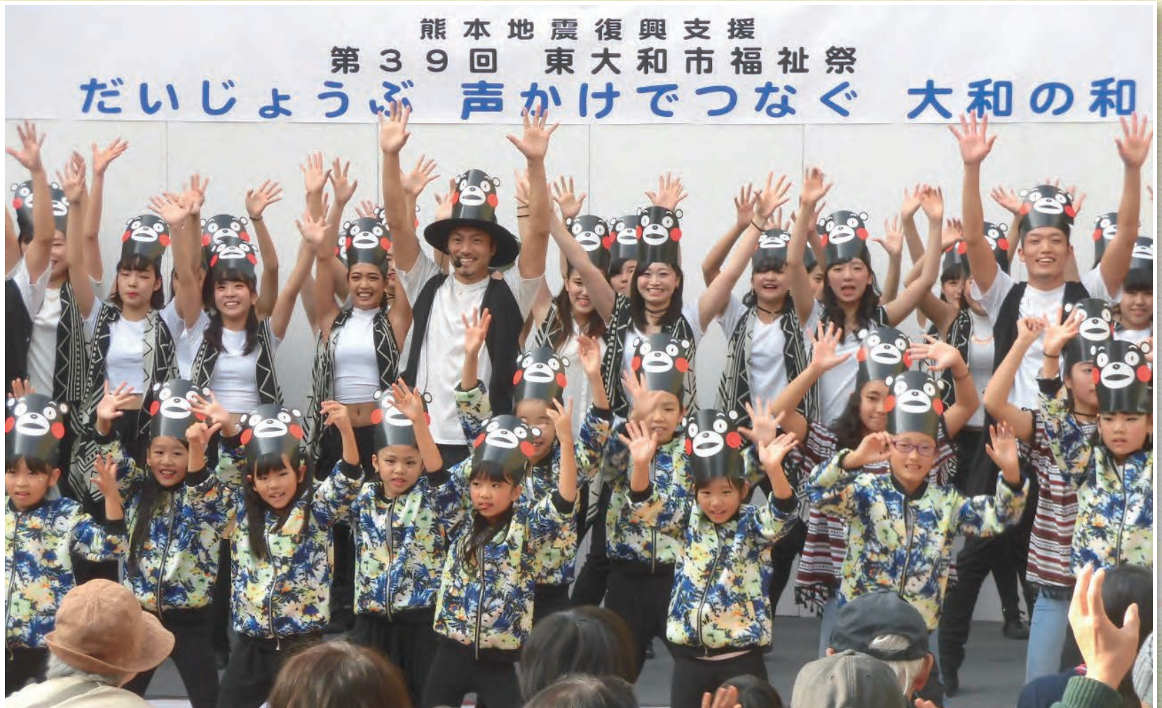
未来を担う若者たち（第39回福祉祭でのくまモン体操 ER'Sの皆さんと）

社会福祉法人 東大和市社会福祉協議会 ☎ 042-564-0012 (代) FAX 042-564-3680 〒 207-0015 東大和 市中央 3-912-3 東大和社協ケアマネジメントセンター ☎ 042-564-0054 東大和社協ホームヘルパーステーション 介護保険 ☎ 042-564-0038 障害者総合支援 ☎ 042-564-2620 ウェルカム（地域生活支援センター） ☎ 042-564-0891 あんしん東大和 ☎ 042-590-0018