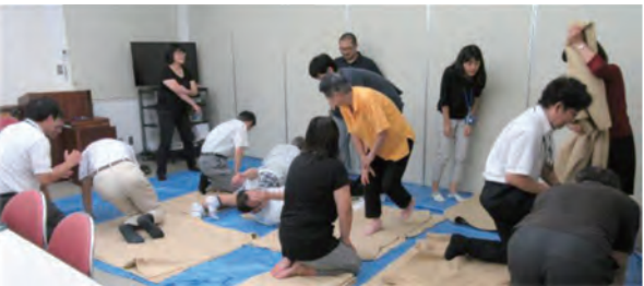
避難所支援訓練の様子