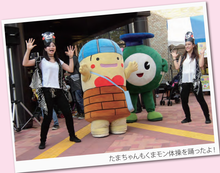
たまちゃんもくまモン体操を踊ったよ!

昨年、みなさんのおかげで楽しい1年になりました。今年もいろいろなところでみなさんとお会いできるのを楽しみにしています。 11月13日(日)に行われた福祉祭に参加しました。当日は天気もよく、たくさんのお友達に会え、たまちゃんも大喜び。みなさんと一緒にくまモン体操を踊り、熊本を応援しました。素敵な福祉祭になりました。ありがとうございました。