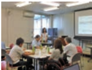
東京都社会福祉協議会職員による講演の様子

7月19日(水)東京都社会福祉協議会の職員の方から「他地区の地域公益活動の状況について」のご講演をいただいた後、東大和市での取り組みについて3グループに分かれ、情報交換を行いました。