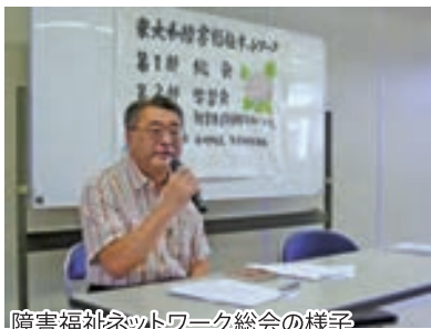
障害福祉ネットワーク総会の様子

また、会報「スタート」の発行により、関係者のみならず、市民への情報提供を行うなど、障害者福祉への理解促進を図っています。