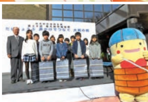
昨年度の福祉祭より 市内の小学生を対象とした福祉標語表彰式の様子

会場 市役所中庭とその周辺 中央公民館ホール (今年はこのもたちのあそびや ゲームコーナーです) ○会場マップ等は 2・3面に掲載して あります。