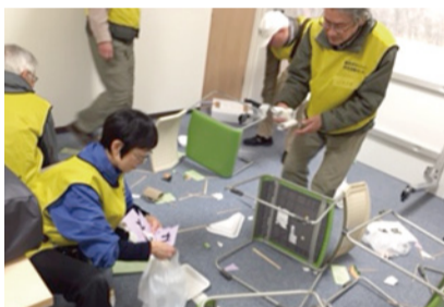
ほっと支援センターなんがいを借りての災害ボラ訓練

災害ボランティアセンターがよりよく機能するためにも、災害時避難行動要支援者(災害時要配慮者)の意見要望をお聞きしながら対策を進めることが重要であると考え、高齢者支援の最前線の現場で活動している立場で、ご協力いただいております。