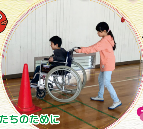
未来を担う子どもたちのために (福祉教育 車いす体験)