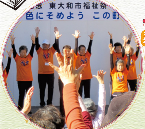
福祉のまちづくりを目指して (福祉祭)