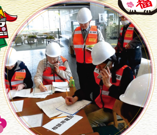
災害に強いまちづくりを目指して (災害ボランティアセンター設置・運営訓練)