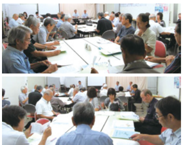
(グループごとの情報交換のようす)

11月12日(日)に行われた福祉祭に遊びにいきました。たまちゃんのみんと会えて大喜び。ステージで行われたダンスに合わせ、たまちゃんもノリノリ。福祉祭を楽しみました。今回からみんなに名前を覚えてもらえるように、名札を付けました。皆さんぜひ名前を覚えて、「たまちゃん」と呼んであげてください。