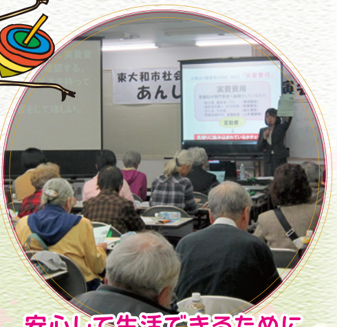
安心して生活できるために (各種講演会の開催)