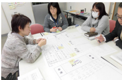
災害ボラセン協議会での学習会の様子