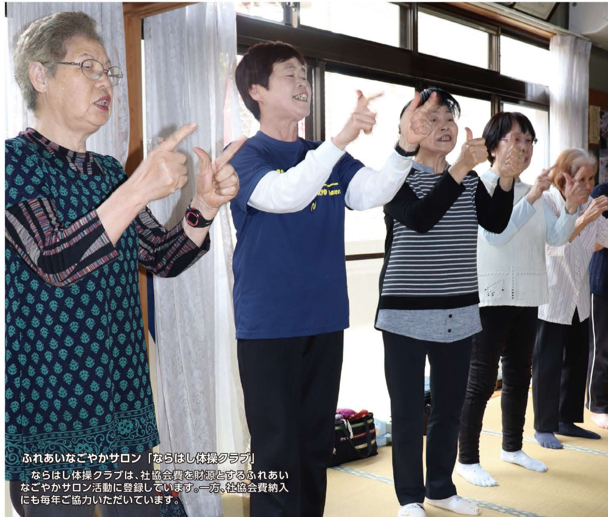
ふれあいなごやかサロン「ならはし体操クラブ」

ならはし体操クラブは、社協会費を財源とするふれあいなごやかサロン活動に登録しています。一方、社協会費納入にも毎年ご協力いただいています。