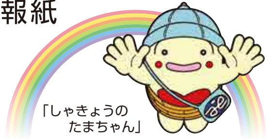
「しゃきょうのたまちゃん」

発行者／社会福祉法人東大和市社会福祉協議会 〒207-0015 東大和市中央3-912-3 TEL:042-564-0012 FAX:042-564-3680 https://www.higashiyamatoshakyou.or.jp/