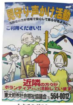
今までのポスター

見守り・声かけ活動 ポスター・チラシ デザイン募集 「見守り・声かけ活動」に関するポスター・チラシを刷新するにあたり、デザインを募集します。「見守り・声かけ活動」は主に高齢者に対し、近所の方（協力員）がボランティアで定期的にお声かけをしたり、周囲から見守りを行い孤立を防ぎ、ふれあいをお届けする活動を行うものです。この度、本事業を広げ、利用者・協力を募集するためポスター及びチラシのデザインを募集します。ポスターは市内の公共機関等に掲示し、チラシは市民等に配布する予定です。たくさんのご応募をお待ちしております。