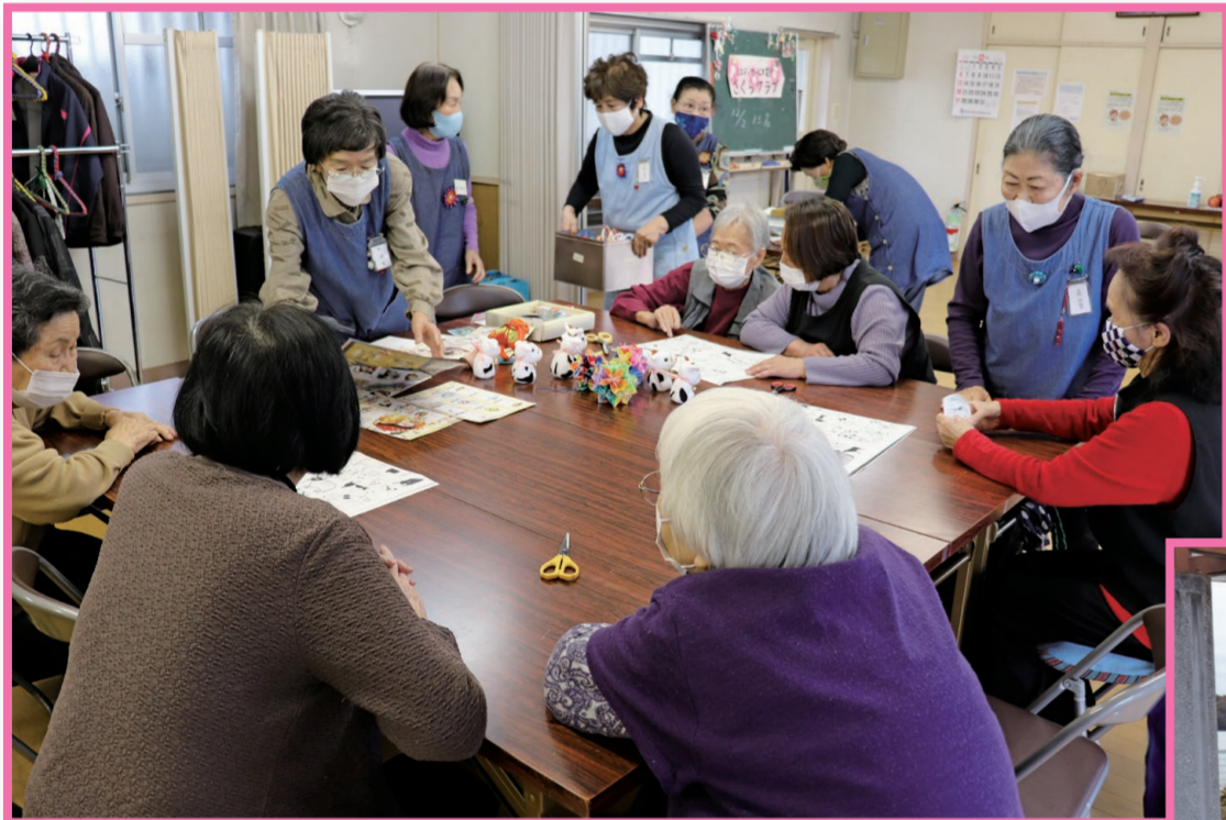
芝中さくらクラブ

【その他の記事】・ボランティア講座等……………P3 ・社協からのお知らせ(あんしん東大和学习会、手話体験講座他)・P4