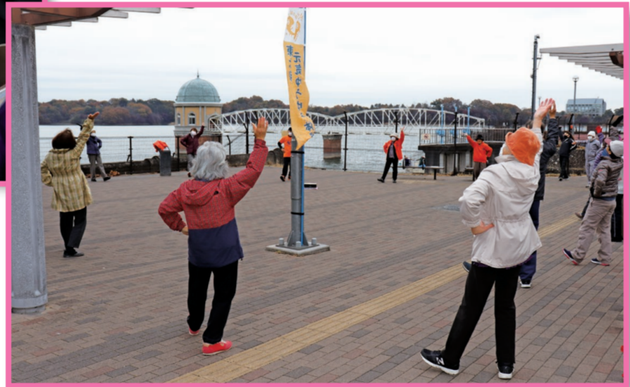
東大和 元気ゆうゆう体操 多摩湖地区