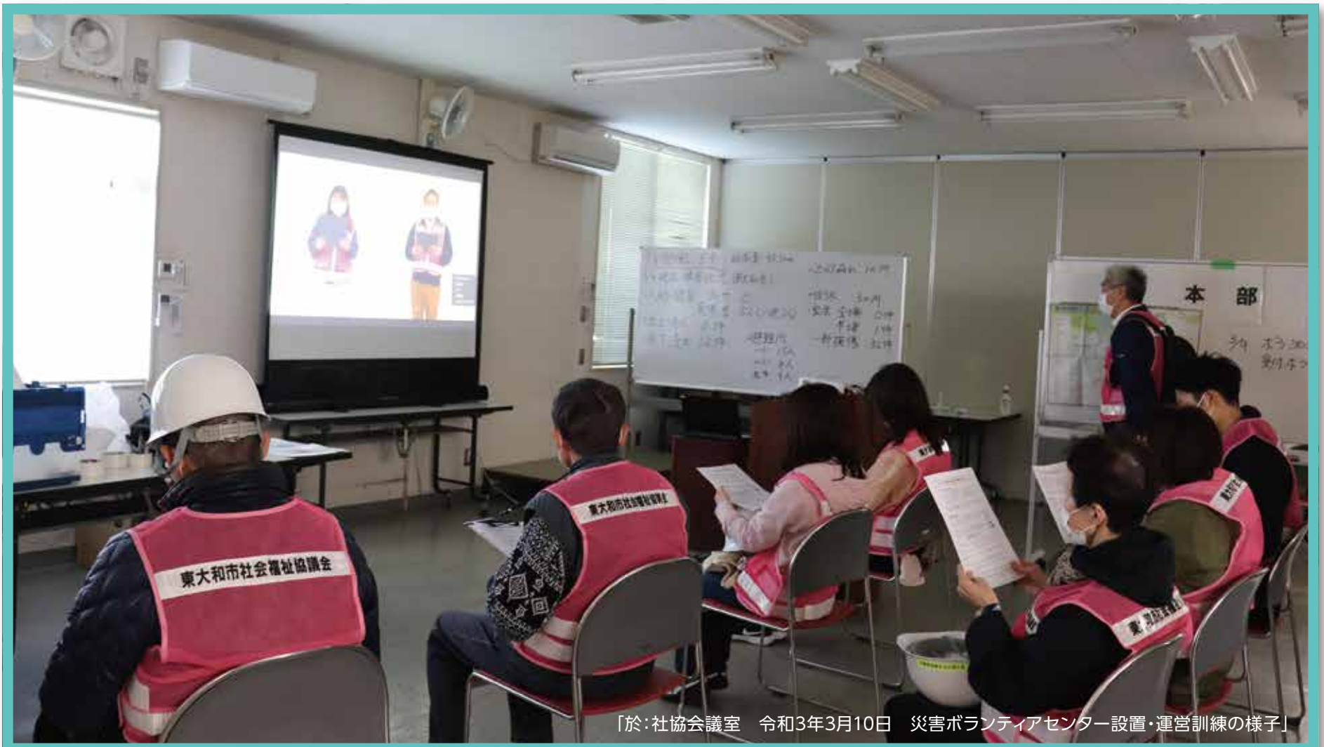
「於：社協会議室 令和3年3月10日 災害ボランティアセンター設置・運営訓練の様子」