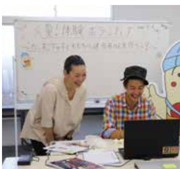
リモート配信の様子

各施設でのボランティアは、一人ひとり目標をもって積極的に参加してくださいました。