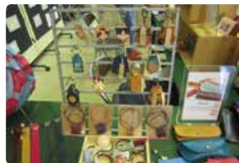
※過去の開催の様子