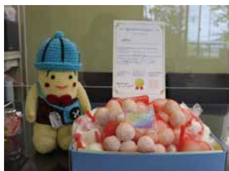
集まったせっけんをカンボジアに贈ります