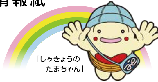
「しゃきょうの たまちゃん」