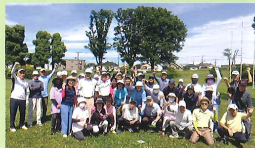
ターゲットバードゴルフの皆さん

活動日：毎週月・水・金曜日 時間：月：8:30～ 水：13:00～ 金：9:30～ 場所：月：上仲原野球場 水：下立野児童公園 金：東大和 Rond桜が丘フィールド (桜が丘市民広場) 参加費：入会1000円 会費600円/月+保険等