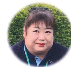
皆さまと一 緒に住んで 良かったと 思える地域を 目指したいと 思います。

はじめまして。 地域の皆さまに東大和市のことを教えて いただきながら、みんなで楽しく、元氣 でいられる地域を目指して尽力してい きたいと思います。 どうぞよろしくお願いいたします！