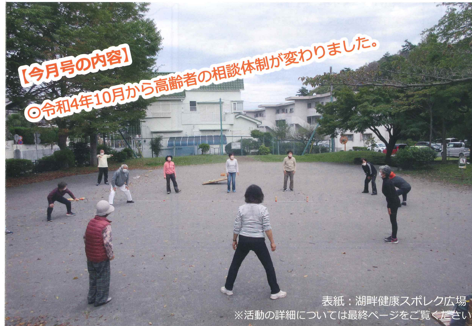
表紙：湖畔健康スポレク広場