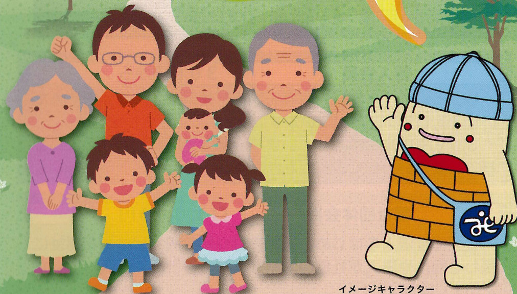
イメージキャラクター 「しゃきょうのたまちゃん」