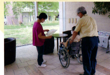
車いすステーション