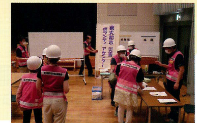
災害ボランティアセンター設置・運営訓練