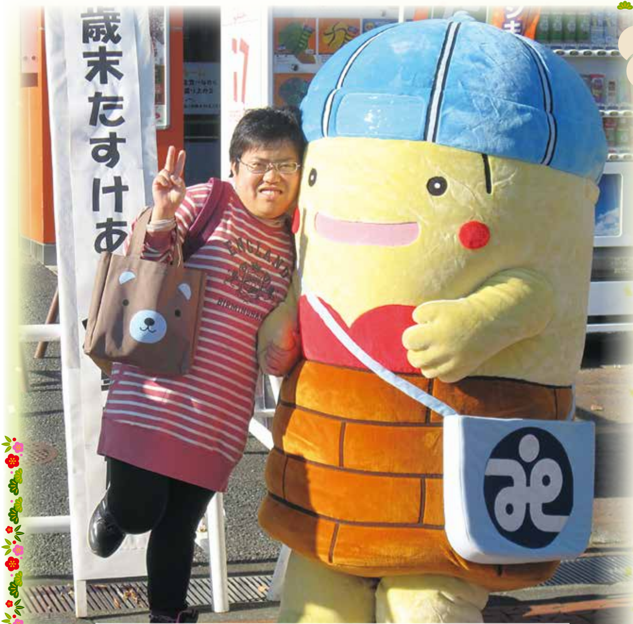
12月1日 東大和市駅前にて 歳末たすけあい運動募金活動を行いました

社会福祉法人 東大和市社会福祉協議会 ☎042-564-0012(代) FAX042-564-3680 東大和市中心3-912-3 東大和社協ケアマネジメントセンター ☎042-564-0054 東大和社協ホームヘルプステーション 介護保険 ☎042-564-0038 障害者総合支援 ☎042-564-2620 ウエルカム (地域生活支援センター) ☎042-564-0891