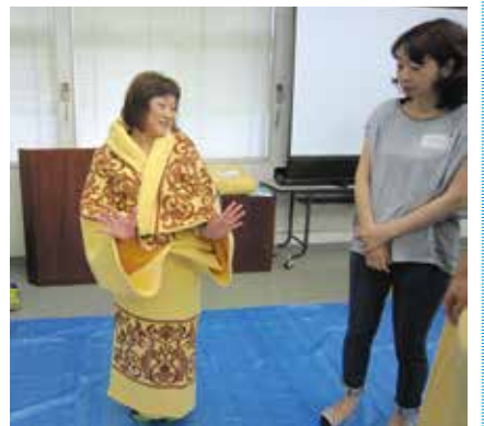
普通の毛布が素敵なガウンに早変わり。

今回は②避難所での高齢者等支援の方法について紹介します。 皆さんは、災害が発生し自分たちが避難所に避難しなければならなくなった時のことを想像したことはありますか？ テレビや写真を通じて映像としては見たことがあっても、あの中に自分をおくという想像はなかなかできないと思います。 しかし、避難しなければならぬという状況は、誰にでも起こり得ることと理解してください。 避難所での生活は当然ながら、自宅とは違いプライバシーが守られない状況や、人がたくさんいて動きにくい、温度なども個人個人に合わせて調節することなどは不可能であり、普段の生活と比べて苦痛を強いられる場面も多くなることが想像できると思います。