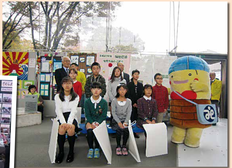
▲福祉標語表彰式で記念撮影