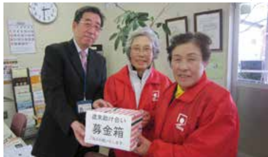
東大和市ゲートボール協会役員の方から当会事務局へ歳末たすけあい募金を手渡される

昨年実施した「赤い羽根共同募金」並びに「歳末たすけあい募金」には、皆さまの温かいご理解とご協力をいただきありがとうございます。お礼を申し上げます。 赤い羽根共同募金 募金総額 961,995円 赤い羽根共同募金は東京都共同募金会で取りまとめ、都内の福祉施設等へ配分します。東大和市でも福祉施設等からの申請に基づき、当会（東大和地区協力会）が東京都共同募金会に推せんを行ない、東京都共同募金会は厳正なる審査を経て配分します。 歳末たすけあい募金 募金総額 (12月24日現在) 1,838,921円 歳末たすけあい募金は、当会が行う自主事業や補助事業でも補助金の付かない事務費等に使用します。