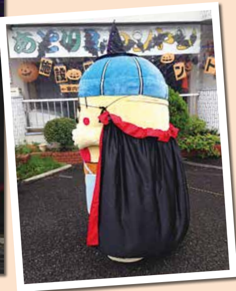
◀後ろ姿も素敵でしょ！