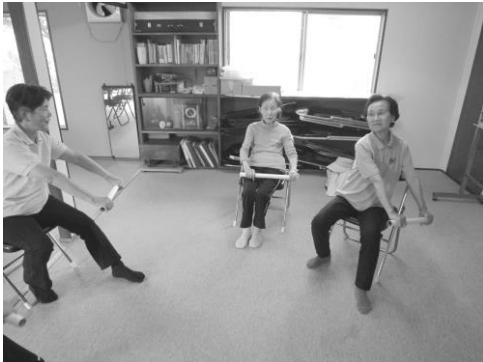
Cグループ。少人数で和気あいあい。