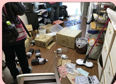
↑地震により物が散らかっている様子を再現