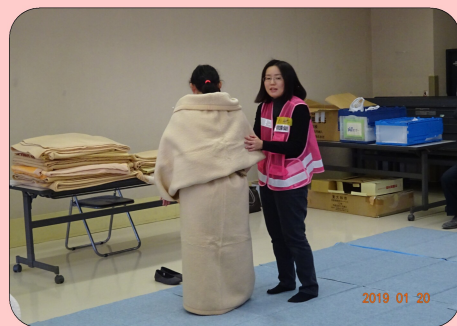
↑毛布で暖をとる方法をレクチャー

災害ボランティアセンターは、災害が発生し東大和市内でボランティアによる支援活動が必要となった際に臨時的に設置されます。