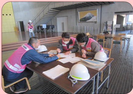
↑調査した内容をまとめています。