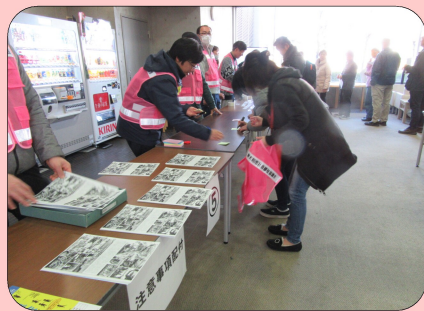
↑受付している様子。