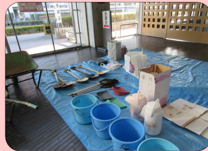
↑活動に使う資機材を並べます。