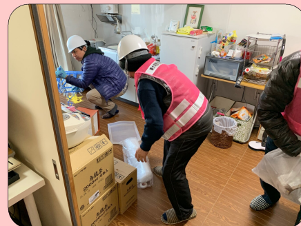
↑部屋を片付ける様子

今回、被災者役としてご協力いただいたのは市民の方。地域には様々なご家庭があること、災害が発生することで、どういったことに困るのかなどを知っていただく機会になればと思い設定しています。