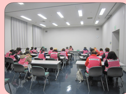
↑ミニ防災講座の様子 備えておくとい物品等を紹介!