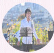
プロ歌手による ステージ

場所は、東大和市郷土博物館の広場、対象者は、子どもとその保護者、郷土博物館屋上にステージを設置 定員は200名で行われました。