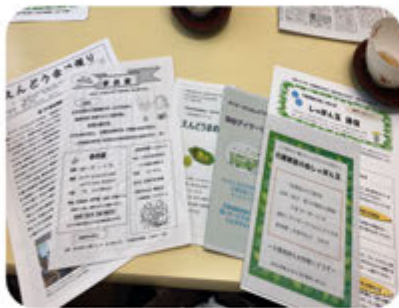
たくさんの広報紙

「特定非営利活動法人まめの会 地域密着型デイサービスえんどうまめ」は、1998年に、奈良橋の郷土博物館近くに木造戸建を借りて利用者6人のデイサービス事業を開始しました。それから10年後に上北台駅と第四中学校近くのマンション1階に移転しました。デイサービス事業利用者10人が楽しい雰囲気の中で過ごしています。