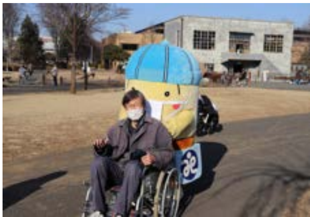
車いすを押すたまちゃん