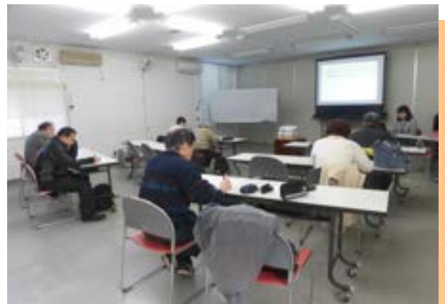
令和元年の講座の様子