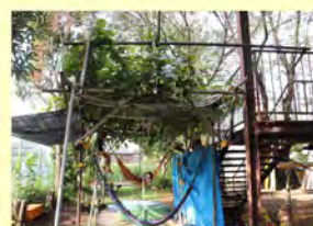
ハンモックの様子