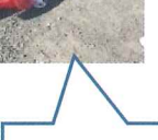
コロナに負けるな!