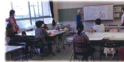
今年の「介護予防 リーダー養成講座」 受講の様子

皆さんも今年デビューした新人リーダーと一緒に、地域で介護予防に取り組みませんか?