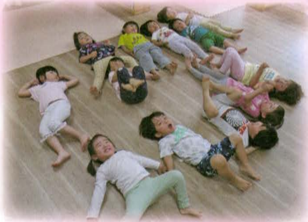
(N)KOTOともぞちネット 陽だまり保育園「こどもたちの保育室を整備しました。」

赤い羽根共同募金は子ども・家庭、高齢者、障がい者、まちづくりの推進など皆様に関わりのあるところで役立てられております。