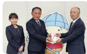
東大和市商工会の皆様からチャリティイベントの売上のご寄附をいただきました。