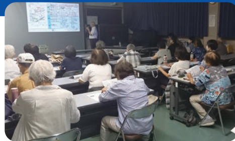
地域の方と共に学ぶ講座

緑豊かな住み慣れた地域で、安心して暮らしていけるお手伝いを私たちは心がけています。