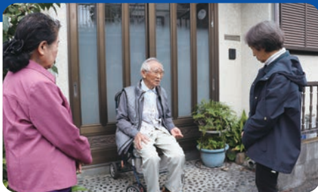
声かけ訪問の様子

狭山丘陵地を中心とした3つの地区で活動しています。訪問すると喜んでいただけることに、私たちが元気をもらいます。交流を増やしていきたいです。