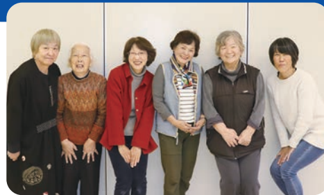
リーダー会の皆さん

各地区の情報をリーダー会に持ち寄り、関係機関と共有しています。第2回のふれあい交流会では男性の参加者が増え、これからも企画を模索していきたいと思っています。