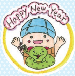
「しゃきょうのたまちゃん」