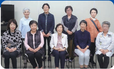
リーダー会の皆さん

平成8年度から活動しています。長きにわたって育んできた地域のつながりを、これからも大切にしたいです。