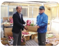
町田実行委員長(右)

去る11月3日・4日、第55回東やまと産業まつりが開催されました。東やまと産業まつり(農業部門)の皆様から、出品された市内の農産物を地域の福祉施設において有効に活用してほしいとのお話があり、養護施設や共同作業所等ご利用いただきました。