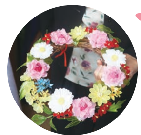
趣味のアメリカンフラワー